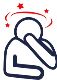
Náuseas y vómitos